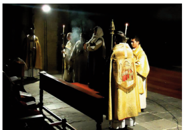
Imatges de la representació extreta de fotografies de la retransmissió del Canal 33 de televisió catalana